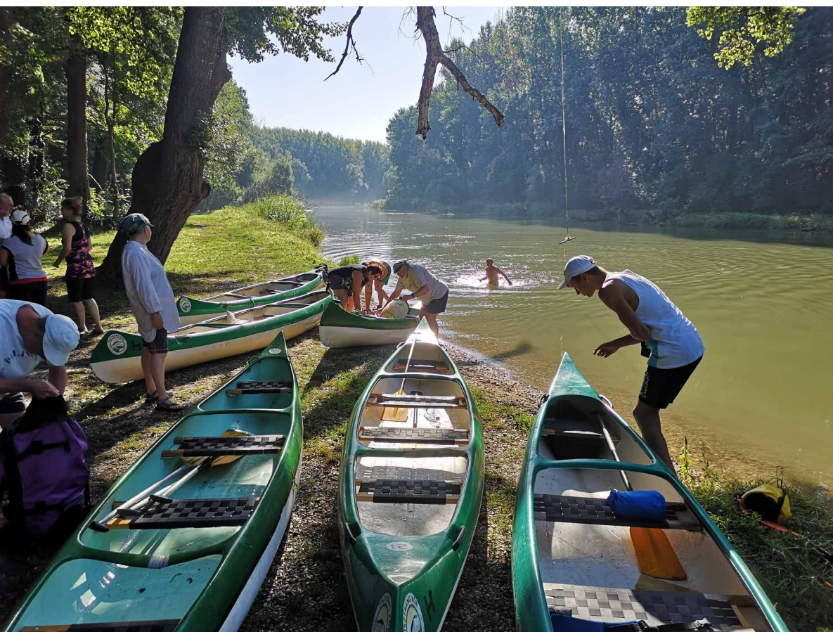
„KÖZÖSEN EGY CSÓNAKBAN” - KENUTÚRA A DUNÁN

VE: Összehangolt – nemzeti vagy az európai uniós forrásokból megvalósuló – fejlesztésekre van szükség. Turisztikai fejlesztési programot készítettünk annak érdekében, hogy a szlovák-magyar határtérség nyugati oldalán a 2021-2027-es időszakban minél eredményesebb legyen az európai uniós alapokból támogatott projektek előkészítése és végrehajtása. Ha sikerül megtalálni a közös kitörési pontokat, és összekapcsoljuk a látványosságainkat, értékeinket és szolgáltatásainkat, az ennek hatására az ide érkező évente több százezer látogató óriási növekedést jelentene a régió életében.