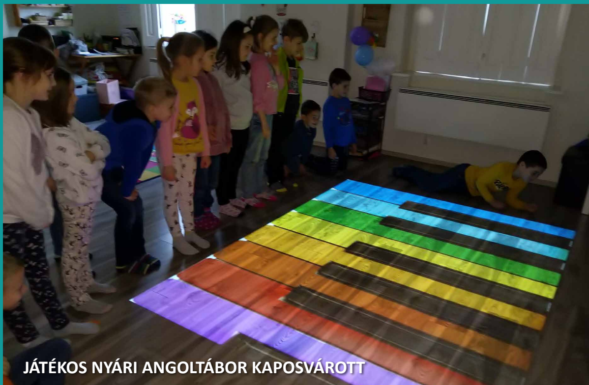
JÁTÉKOS NYÁRI ANGOLTÁBOR KAPOSVÁROTT

További információt a www.szpi.hu oldalon találhatnak.