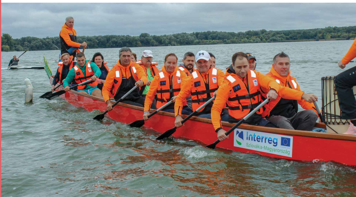
„EVEZZÜNK A KÖZÖS CÉLÉÉRT” - SÁRKÁNYHAIÓZÁS A TATAI ÖREG-TAVON

OMJ: Ha bárkinek van bármilyen kérdése a Kisprojekt Alap szintjén a megvalósításban, akkor forduljon hozzánk mindig bizalommal. Azért vagyunk itt, hogy segítsük a partnereink munkát. Voltak pályázóink, akik a COVID-19-járvány miatt vagy más okoknál fogva visszaléptek, azokat a pénzüsségeket újra lekötöttük más pályázatokra. Különböző egyeztetéseket, konzultációkat tartunk, naponta hívnak a pályázók, hogy mit tudnának megváltoztatni. Tudom, hogy ez a helyzet összetett és nem egyszerű ilyenkor tervezni, főleg hosszú távon, de szerintem mindenre találunk közös megoldást.