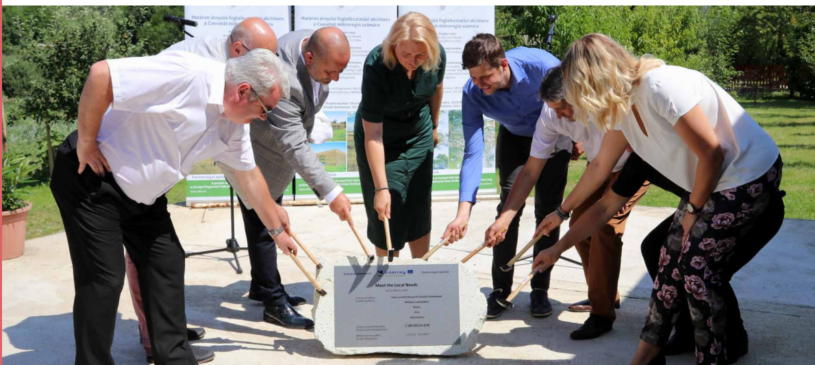
AZ ENCSI, A HIDASNÉMETI ÉS A GAGYVENDÉGI PIAC ALAPKÖLÉTELE

Még 2016-ban indítottunk el egy programot, ahol az általunk biztosított Lego robotokkal kezdtek foglalkozni a gyerekek az alapiskolákban. Most ezt egy nagyobb projektben valósítjuk meg Kassa megye és Szabolcs-Szatmár-Bereg megye alap- és középiskoláiban, mert a diákok minőségi oktatása kiemelt célunk. Nagyon fontosnak tartjuk az idősek helyzetét is. Jelenleg futó pályázatunkkal egy aktív öregedési központot hozunk létre annak érdekében, hogy minél jobban kitoljuk azt az időszakot, amikor már rá lesznek utalva valakinek a segítségére.