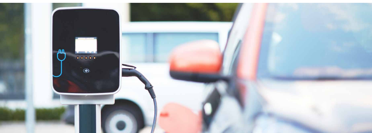
9 ÉVEN BELÜL 3 MILLIÓ TÖLTŐÁLLOMÁST ALAKÍTANA KI A BIZOTTSÁG