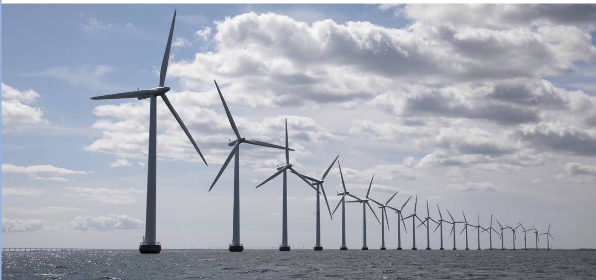
A DÁN MIDDELGRUNDEN SZÉLFARM AZ ØRESUND SZORÓSBAN

Ennek a középtávú tervnek a megvalósításáról szól az Európai Bizottság új uniós klímaterve, a 13 jogszabály-javaslatot tartalmazó Fit for 55 néven is emlegetett csomag. Egyik fontos eleme az Európai Unió Kibocsátás-Kereskedelmi Rendszerének (ETS) megváltoztatása. Ez a mechanizmus megszabja a szén-dioxid árát, és előírt éves csökkentését, vagyis az egyes gazdasági ágazatok kibocsátásának felső határát. Az elmúlt 16 évben például 42,8%-kal sikerült csökkenteni az energiatermelés és az energiaigényes ipar kibocsátását.