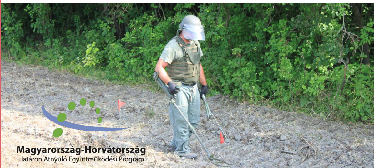
Magyarország-Horvátország Határon Átnyúló Együttműködési Program